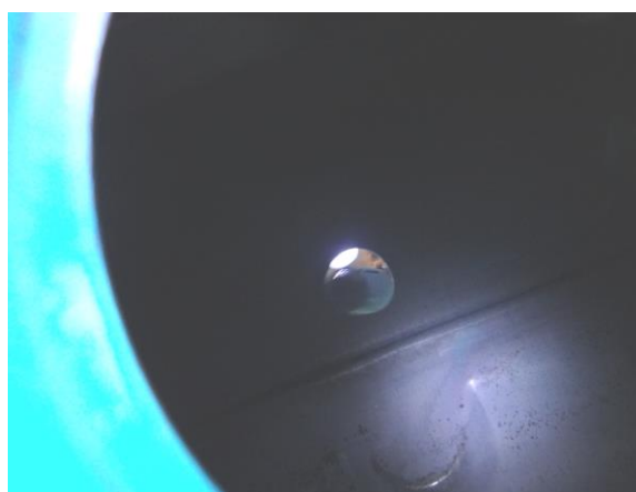
* 洗浄後タンク内部の状態(イメージ)