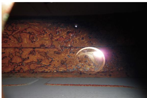
* 洗浄前タンク内部の状態(イメージ)

長年使用しているホームタンクは、内部が「鉄サビ・ヘドロ・ゴミ・水分」などの汚れでいっぱい！